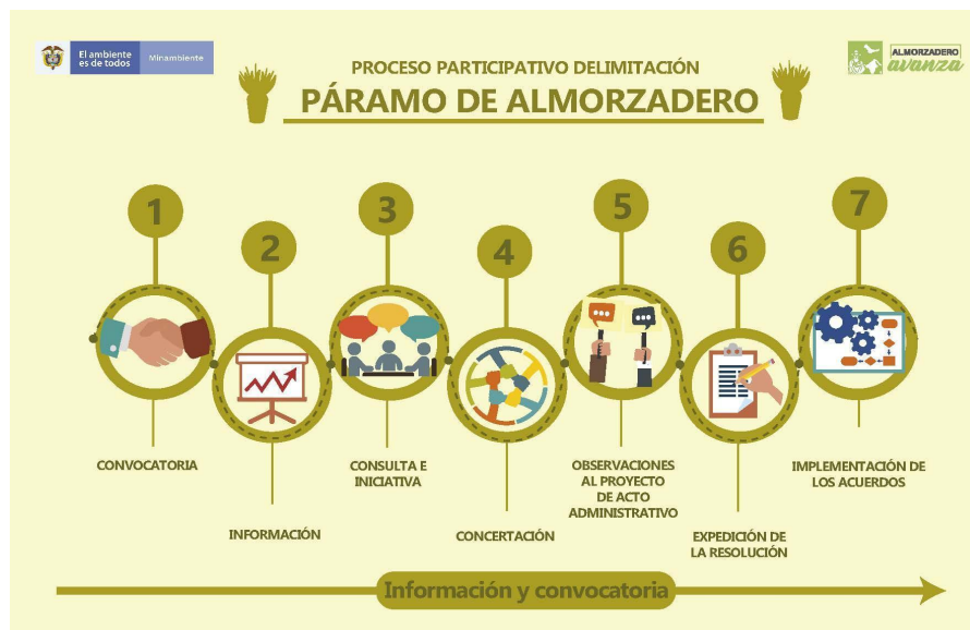
Figura 1. Fases del proceso participativo de delimitación del páramo de Almorzadero de acuerdo a lo estipulado en la Sentencia T-361 de 2017 proferida por la Corte Constitucional, con relación a que la nueva delimitación.