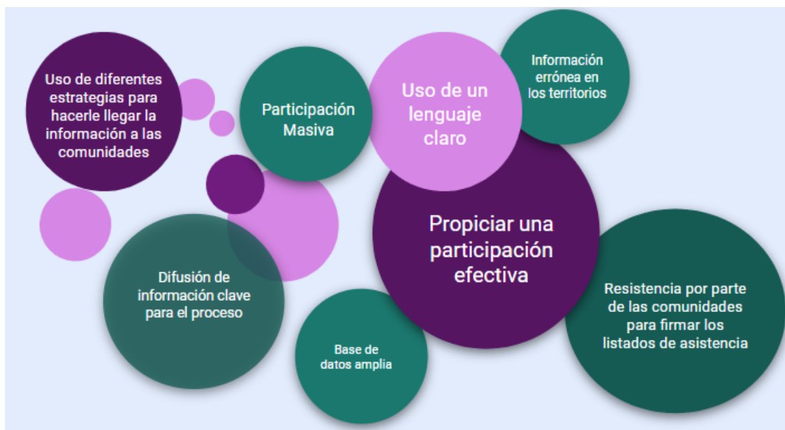
Figura 9. Resultados de Preguntas abiertas aplicadas en las reuniones de los días 09/07/2020 y 18/08/2020 con SINA y Entes Territoriales.

Gobernaciones y las Personerías. Estos resultados brindan elementos que deben ser considerados a la hora de construir piezas comunicativas, de los mensajes que deben difundirse y de las formas como se establece comunicación en los territorios con las comunidades.