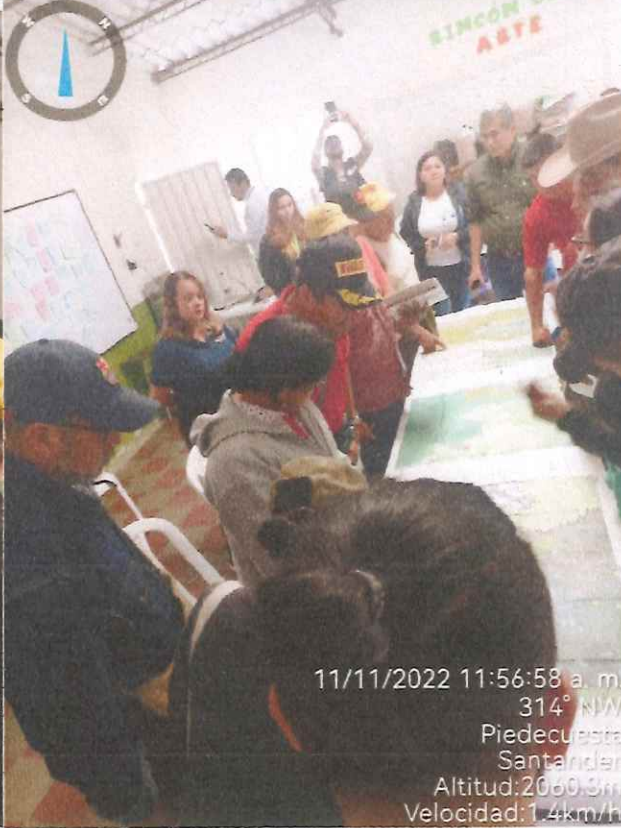
11/11/2022 11:56:58 a. m. 314° NW Piedecuesta Santander Altitud:2060.3m Velocidad:1.4km/h