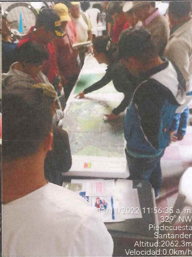
11/11/2022 11:56:35 a. m. 329° NW Piedecuesta Santander Altitud:2062.3m Velocidad:0.0km/h