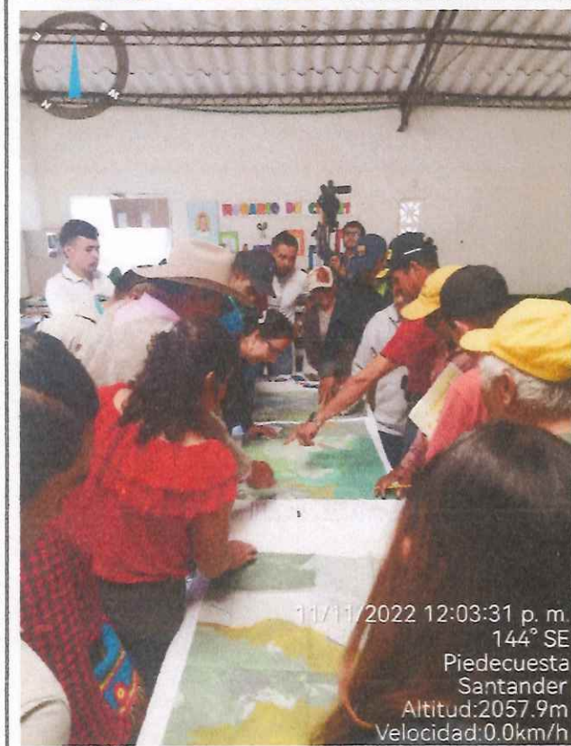
11/11/2022 12:03:31 p. m. 144° SE Piedecuesta Santander Altitud:2057.9m Velocidad:0.0km/h