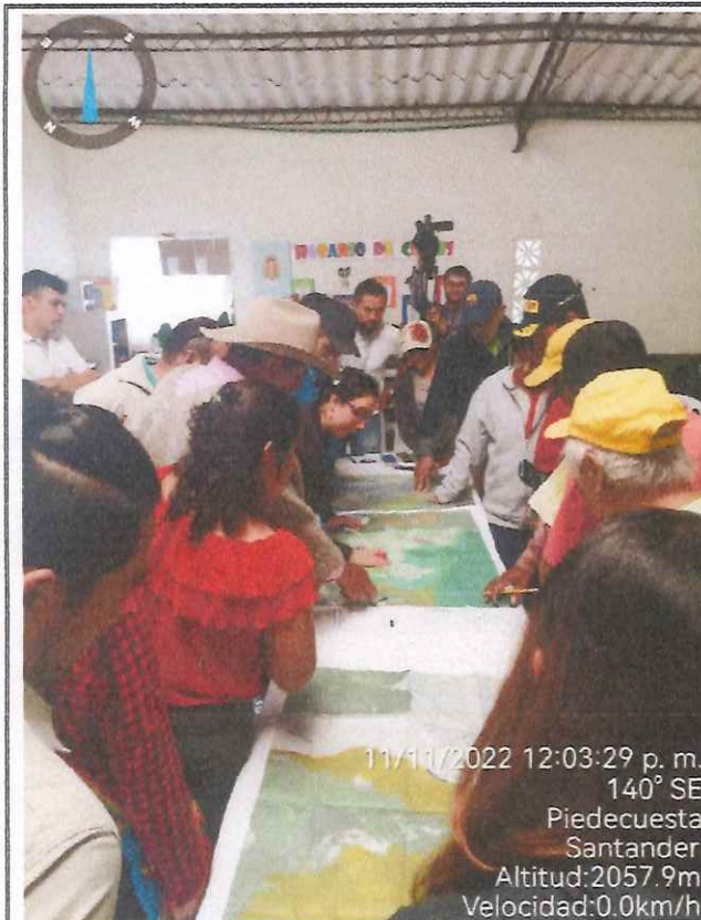
11/11/2022 12:03:29 p. m. 140° SE Piedecuesta Santander Altitud:2057.9m Velocidad:0.0km/h