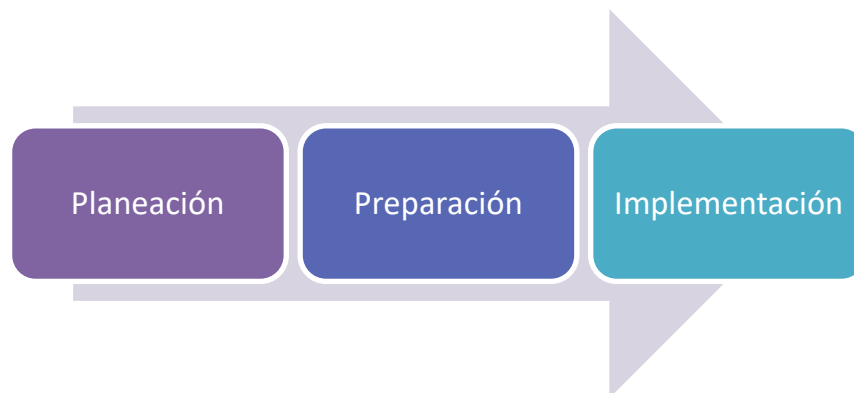
Imagen 3. Momentos de la metodología de escenarios simultáneos de participación

Para el desarrollo de estos escenarios se propone tres (3) momentos, de la siguiente manera: